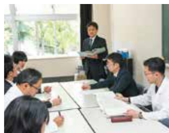
進路検討会(年2回程度)

学問探究の意義を確認し、大学連携の情報を共有し、高い進学意識を継続するために、定期的に学年集会を行っています。