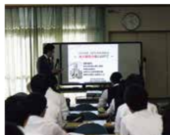
東大・医学部説明会/勉強会

検討会で共有した情報を基に、生徒一人一人と直接対話をしながら、学習・進路アドバイスやメンタルケアを行っています。