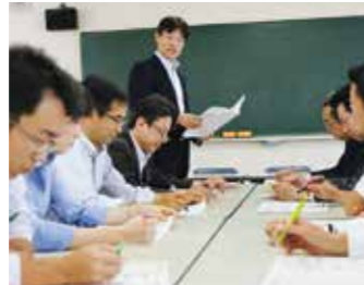
進路検討会(年2回程度)