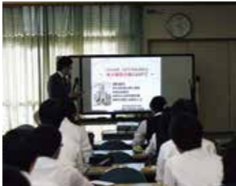
東大・医学部説明会/勉強会

学問探究の意義を確認し、大学連携の情報を共有し、高い進学意識を継続するために、定期的に学年集会を行っています。